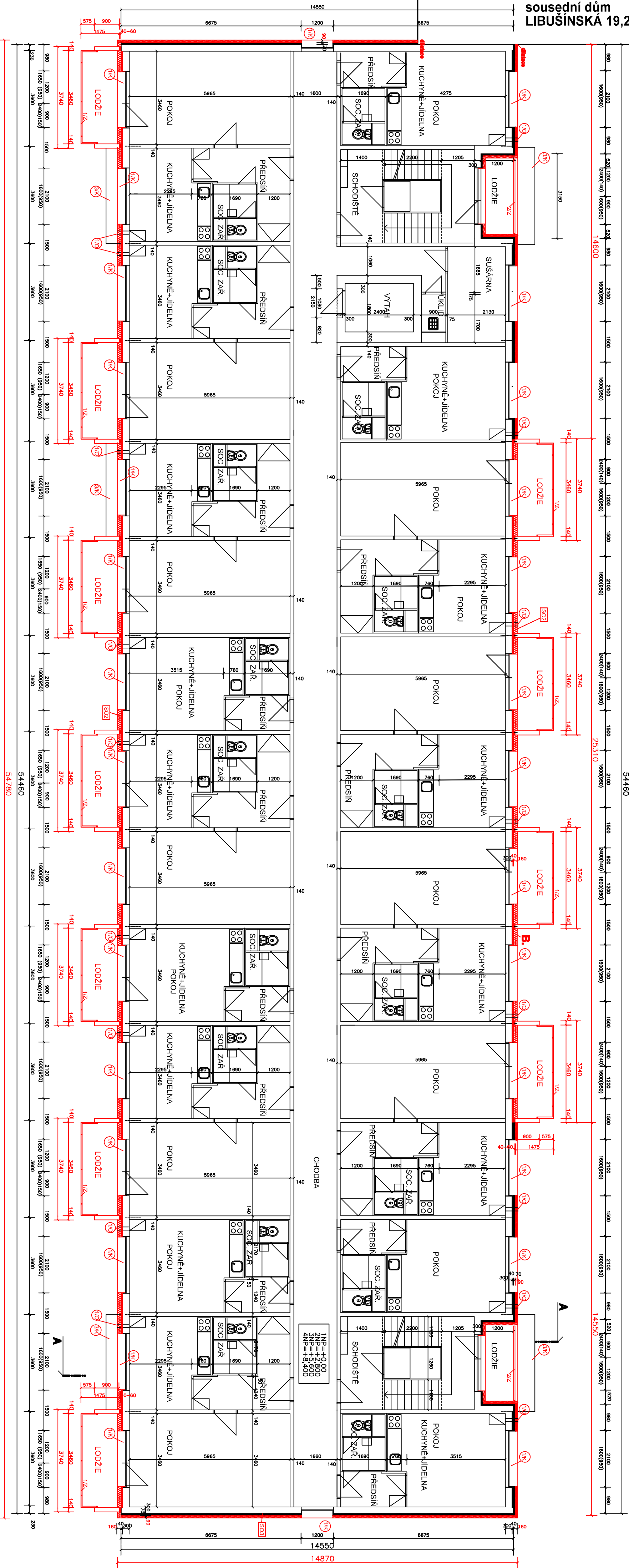
VSTUP Z ČELNÍ STRANY